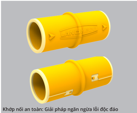
Khớp nối an toàn: Giải pháp ngăn ngừa lỗi độc đáo

Chúng tôi đã tiến hành các thử nghiệm đối với khớp nối an toàn trong hơn một năm. Trong quá trình đó, sản phẩm đã tự chứng minh sự hoàn hảo về cả tính năng, độ bền và thiết kế của mình.