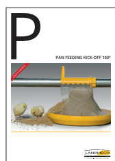
MÁNG ĂN KICK-OFF 160°

Xem thêm các sản phẩm khác của LANDMECO: (LANDMECO có quyền thay đổi thông số kỹ thuật mà không cần thông báo trước)