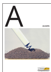
HỆ THỐNG VÍT TẢI