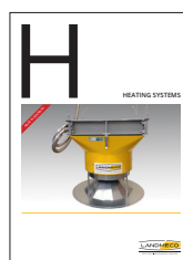
HỆ THỐNG SƯỞI